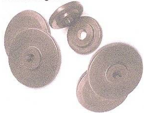
Galets spéciaux pour tube carré et rectangulaire